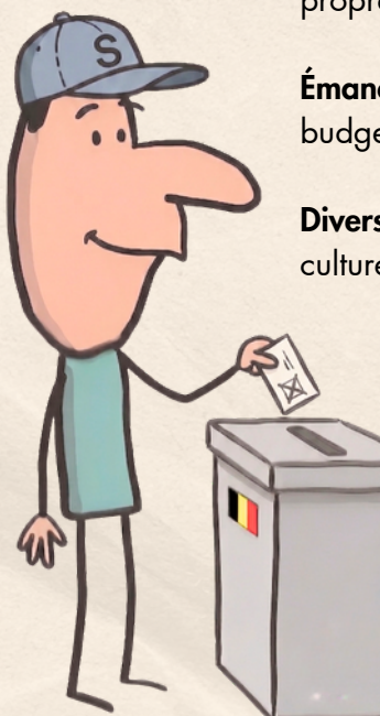
Généré par l'IA

Diversité : cela permet de faire émerger des formes de culture que les institutions culturelles de la ville de Tournai peuvent parfois oublier (culture urbaine, ...).